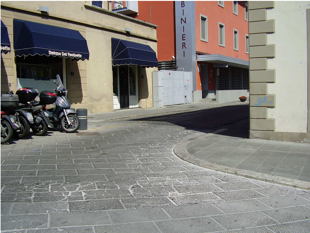
Foto 3 - Intersezione tra Via Verdi e Via Corsi Salviati